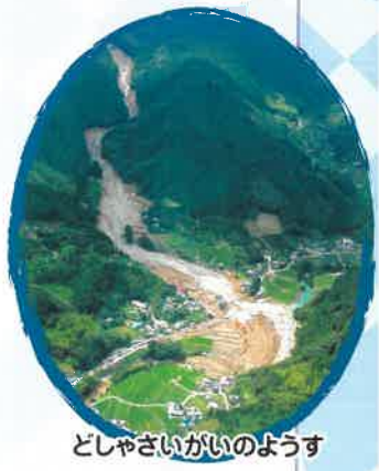
どしゃさいがいのようす

これまでの入賞作品は国土交通省砂防部Webサイトで見ることができます。 http://www.mlit.go.jp/mizukokudo/sabo/kaiga_sakubun.html