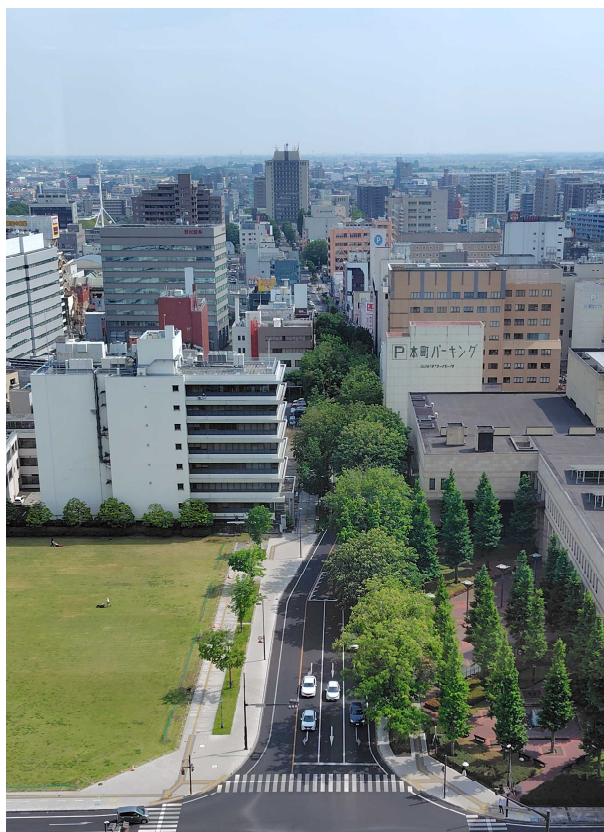
シンボルロードの現況 (県庁15階ロビーから望む)

皆さまからの貴重な「声」を、ぜひお聞かせください。 まちづくり・みちづくりを、一緒に考えていきましょう。