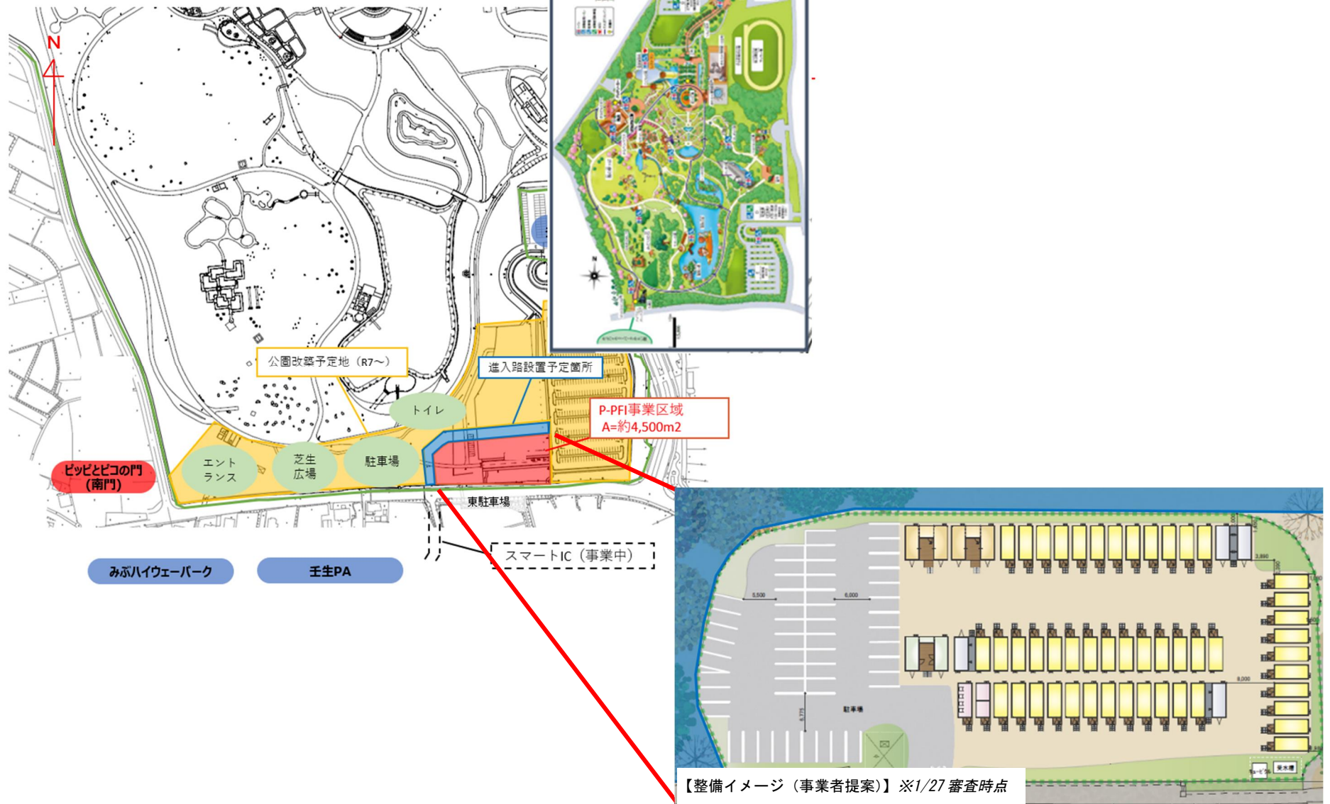
(参考)【事業区域・平面図】