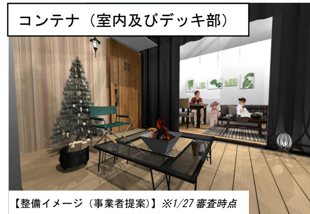
コンテナ（室内及びデッキ部）