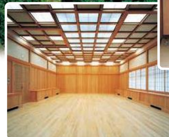
研修ホール(有料:広さ40坪)