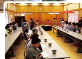
研修ホール利用状況