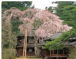
樹齢400年を数えるシダレザクラ