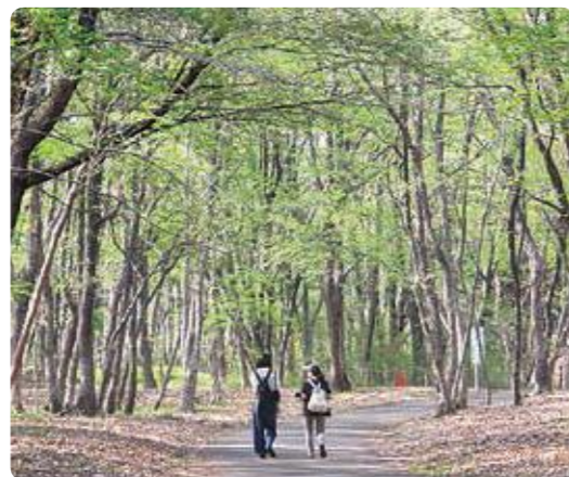
赤松ロード(とちぎ健康づくりロード)

・JR西那須野駅から塩原温泉バス「千本松」下車 徒歩約20分 ・東北自動車道「西那須野塩原IC」から約2km