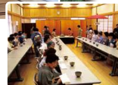
研修ホール利用状況