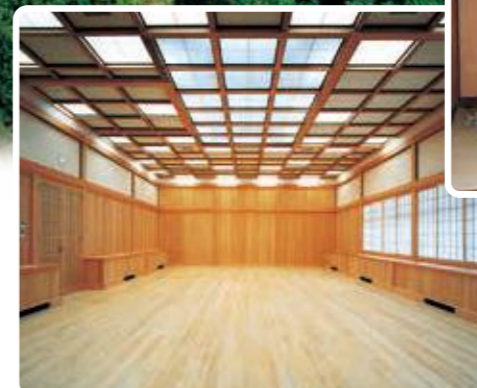
研修ホール(有料:広さ40坪)