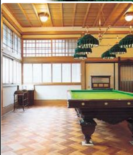
御玉突所 当時の様子を再現しました。