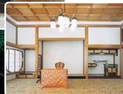
謁見所 天皇陛下が公式の面会に使用された部屋です。