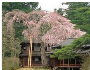
樹齢400年を数えるシダレザクラ