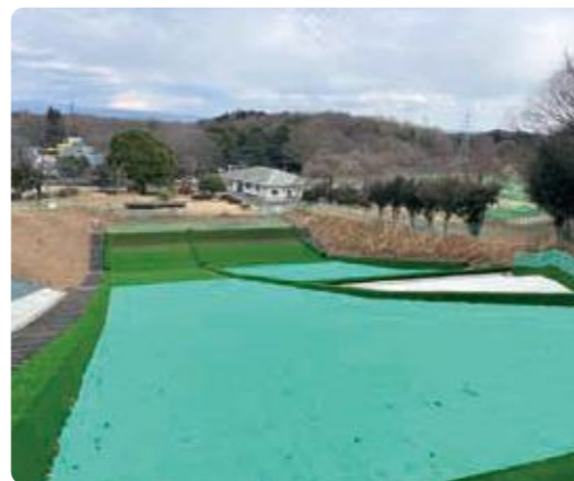
そり遊び広場(令和8年3月リニューアルオープン)