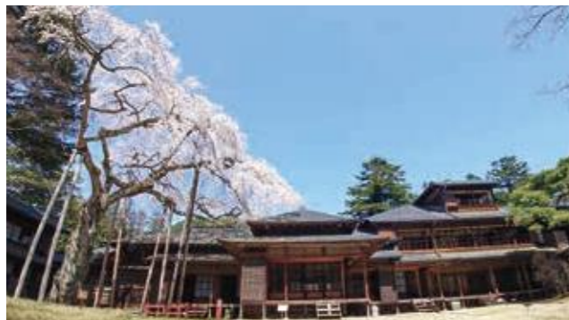
御座所南入側&杉戸絵

「木材の宝石箱」と呼ばれた謁見所など、江戸・明治・大正時代における最高の建築技術をご堪能ください。