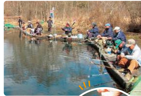
ヘラブナ釣りの太公望