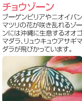
リュウキュウアサギマダラ