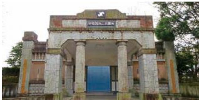
p11 南門近く「旧宇都宮商工会議所ポーチ」

宇都宮商工会議所の創立30周年を記念し、大正11年に栃木県技師・宇都宮工業学校(現・栃木県立宇都宮工業高等学校)の初代校長であった安美賀(1885~1953年)氏の設計により、昭和3年に竣工しました。