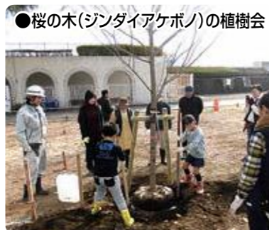
●桜の木(ジンダイアケボノ)の植樹会

野球、テニス、陸上、サッカーなどの大会が開かれる本県のスポーツの殿堂ですが、散歩、ジョギング、昼寝を楽しむ人も結構多い公園です。 また、総合スポーツゾーン整備にあわせ、老木となった桜の木の世代交代を行いました。