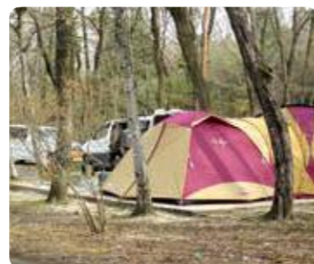
オートキャンプサイト