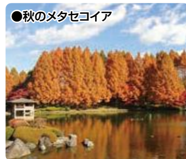
●秋のメタセコイア