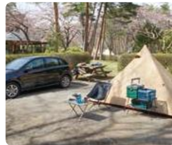
オートキャンプサイト