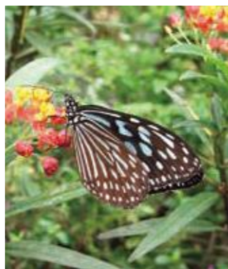
リュウキュウアサギマダラ

井頭公園内花ちょう遊館には美しいチョウたちが集まっています。約300頭のチョウたちの舞う姿は必見です!