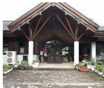
サービスセンター