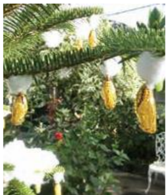
黄金のサナギ(オオゴマダラ)

クリスマス頃になるとモミの木に金色に輝く「オオゴマダラ」、エメラルドグリーンの「リュウキュウアサギマダラ」などのサナギが延べ200個以上飾られます。