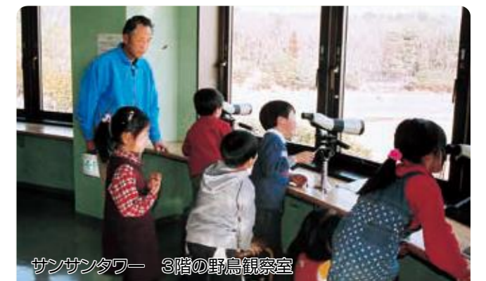
サンサンタワー 3階の野鳥観察室

アカマツ・クヌギ・コナラなどの樹林に囲まれ、緑豊かな自然に恵まれた園内では、数十種に及ぶ野鳥が観察できます。また、展望塔3階の野鳥観察室からは、隣接する赤田調整池に飛来する水鳥を観察できます。