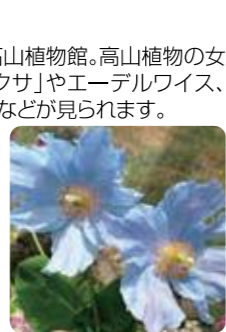
ヒマラヤの青いケシ