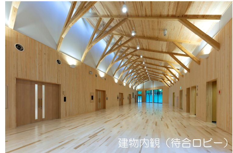
建物内観（待合ロビー）