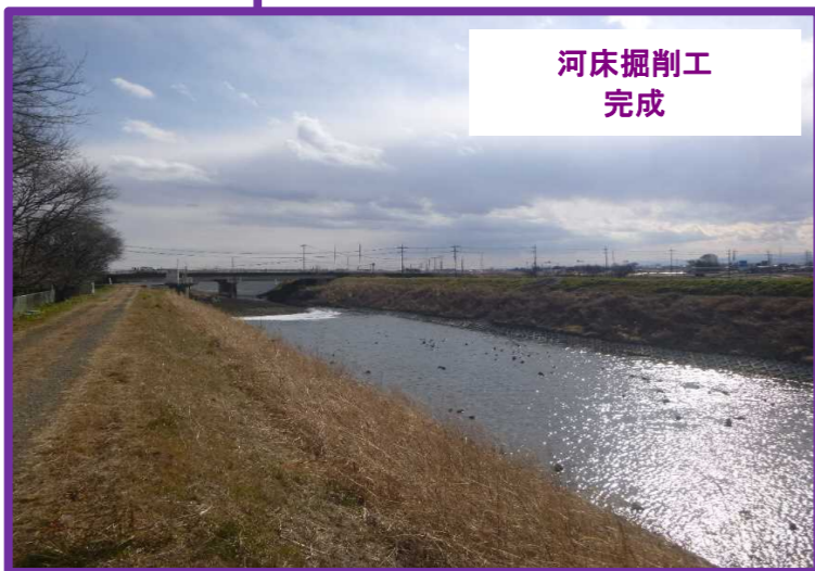
開削工事秋山川その1 榎並木土建 河床掘削工:洪水時に多くの水を流せるように河床を掘削して断面を大きくします。