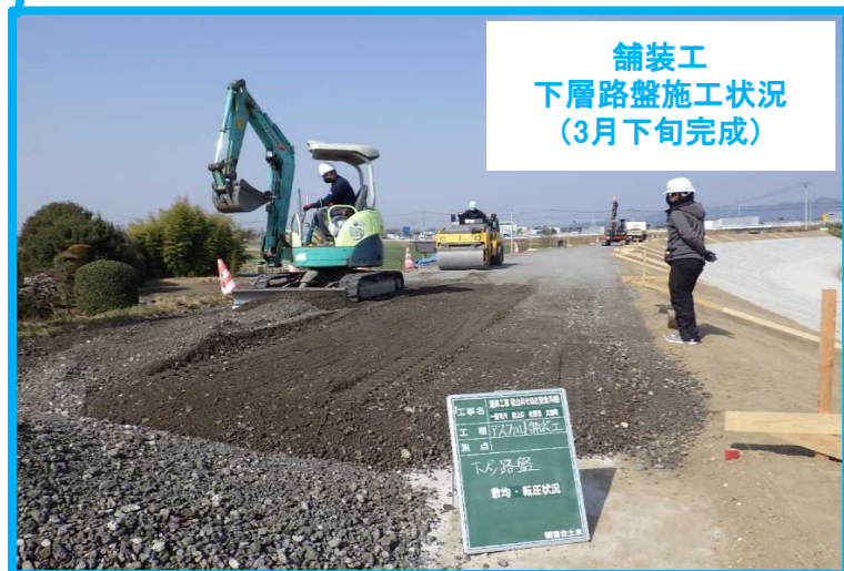
護岸工事秋山川その2 榎落合土木 堤防法面を守るためにコンクリートブロックや張芝などを施工します。