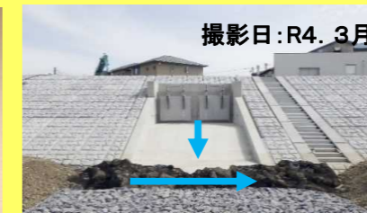
撮影日: R4. 3月 現在の弊社施工 排水樋門改築工事 秋山川その3 護岸工事