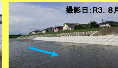
撮影日: R3. 8月 昨年の弊社施工 秋山川その23(激甚対策)