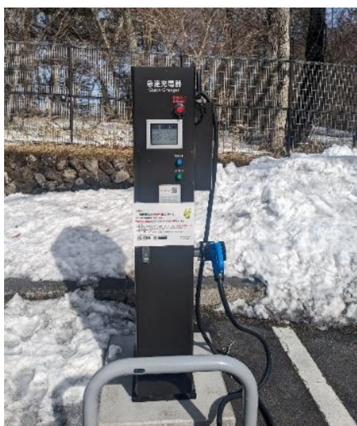
【華厳の滝第一駐車場】