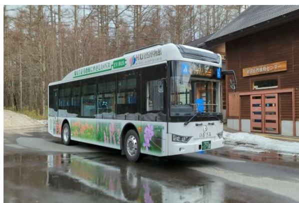
《低公害バス のあざみ》