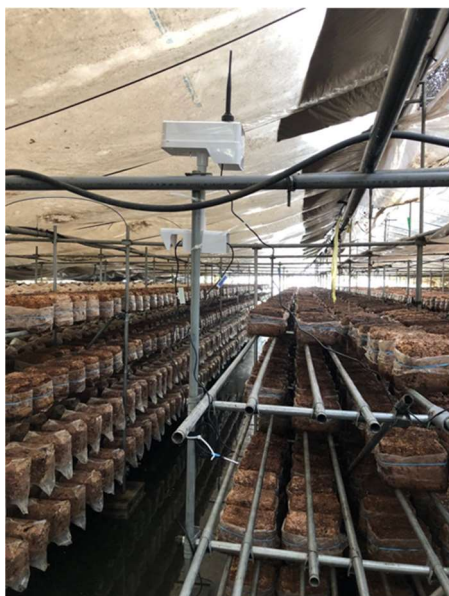
【ハウス内の機器設置状況】