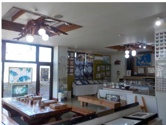
【1階 マロニエ昆虫館】