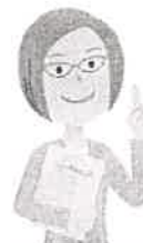
労働者委員 労働組合の 役員など