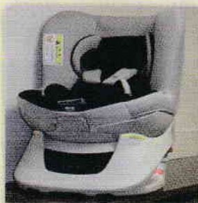
チャイルドシートの貸出しを無料でを行っています。