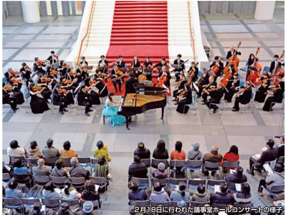
2月18日に行われた議事堂ホールコンサートの様子