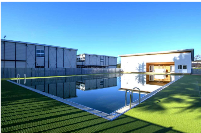
学校水泳プール 外観