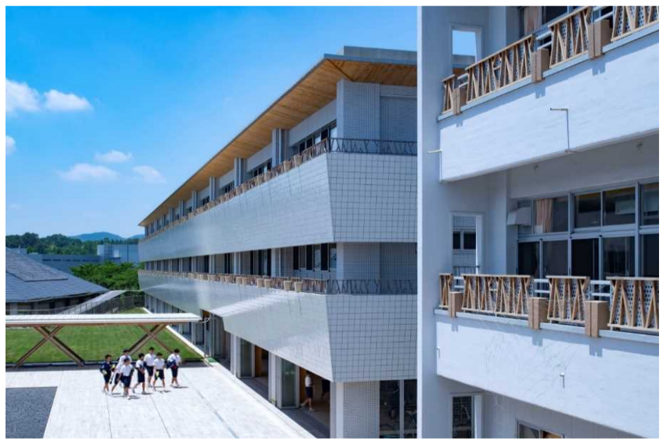
新校舎 及び 既存校舎・改修後 外観