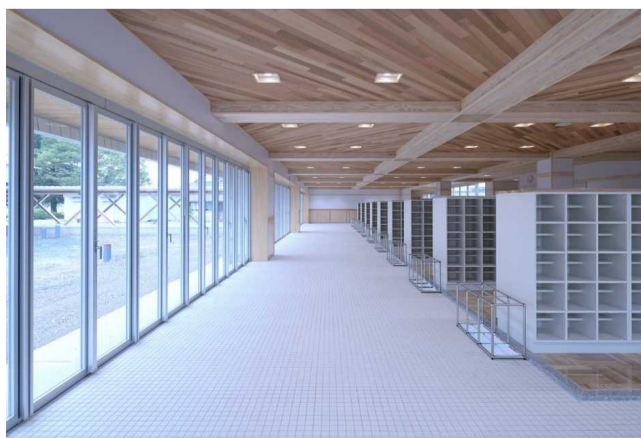
新校舎 内観（昇降口）