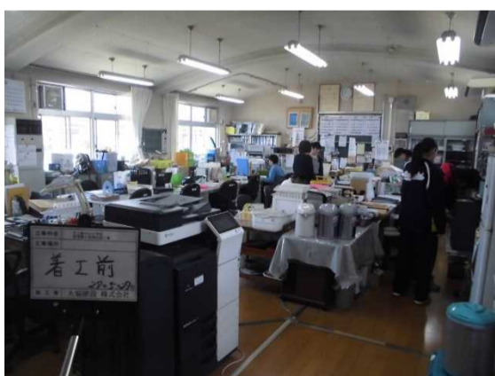
職員室 改修前：蛍光灯