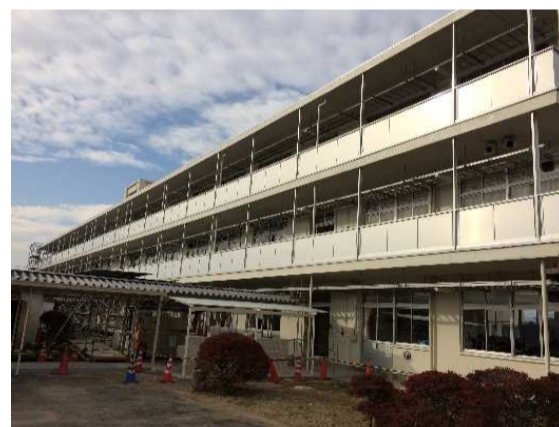
特別・教室棟南側外観 改修後