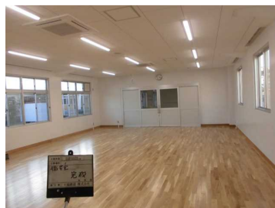
職員室 改修後：LED 灯