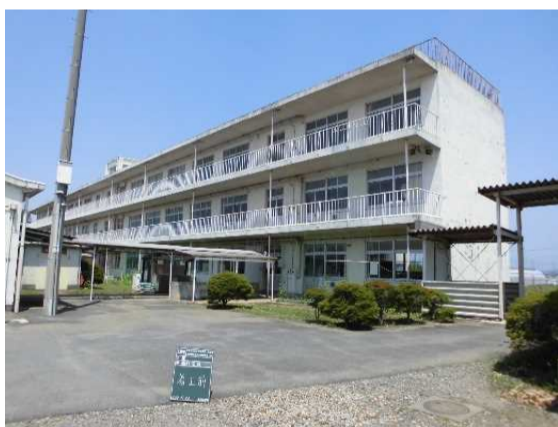
特別・教室棟南側外観 改修前