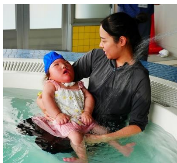
医療的ケア児の学習の様子