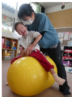
「自立活動」学習の様子