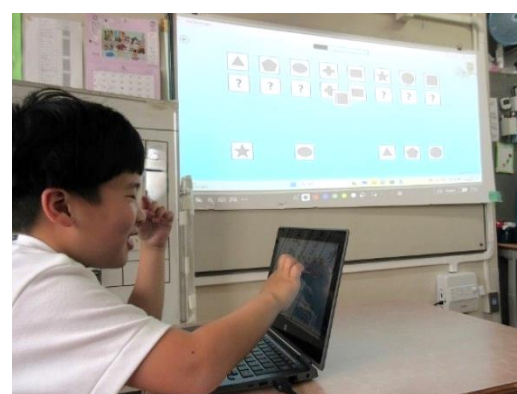
デジタル学習基盤を活用した授業の様子