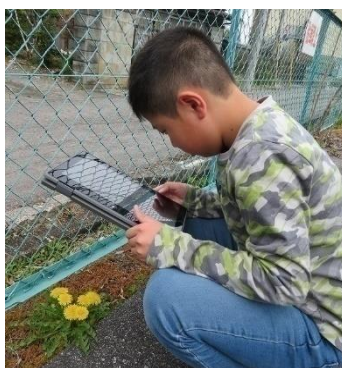
主体的に ICT を活用している学習の様子