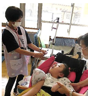
安全・安心 医療的ケア (学校看護師と教員の連携)