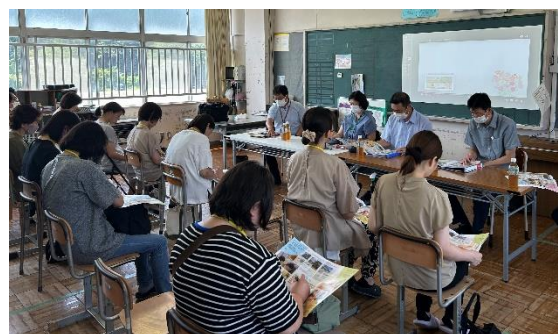
企業向けセミナー (特別支援学校生徒の就労に対する理解促進)