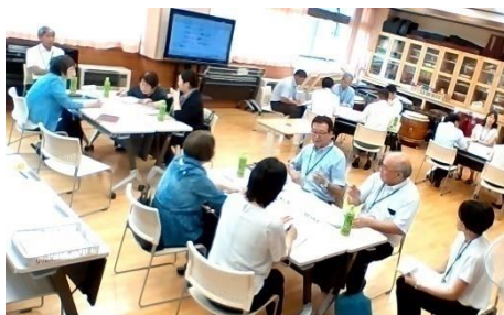
コミュニティ・スクール等の様子