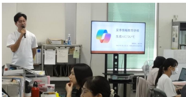
教員を対象とした ICT 活用指導力の向上を図る研修の様子