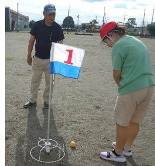
地域の方との交流活動