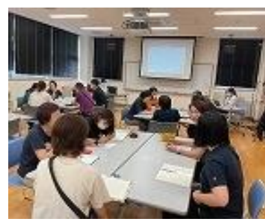
教員対象の研修の様子