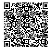
活用型情報モラル教材 「GIGA ワークブックとちぎ」