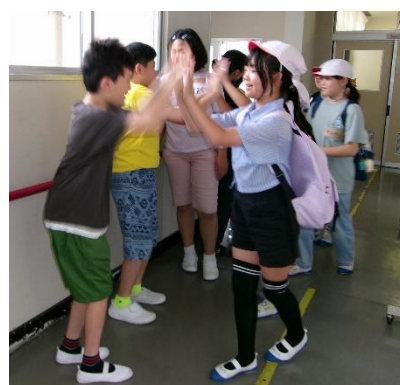
友情を育む 交流及び共同学習