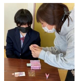
さくら市「でまえ学び塾」 喜連川公民館・つまみ細工体験講座