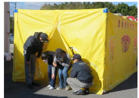
火災発生時を想定した煙体験