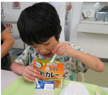
災害用備蓄食品の試食