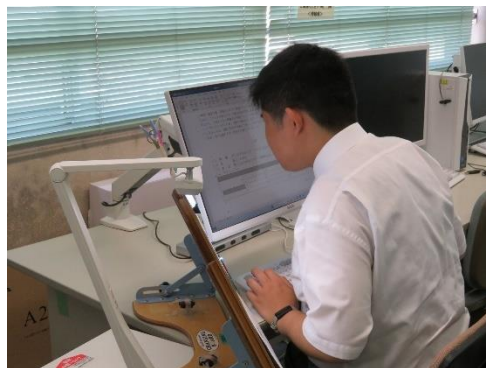
補助用具を活用した学習の様子