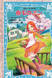
『赤毛のアン』 (モンゴメリー／著 村岡花子／訳 講談社)