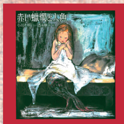
『赤い蝋燭と人魚』 (小川未明／文 酒井駒子／絵 偕成社)