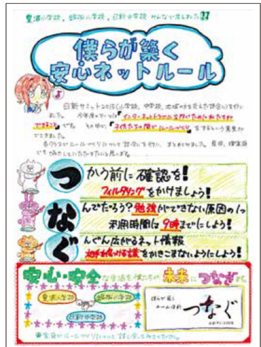
▲生徒が作成したリーフレット