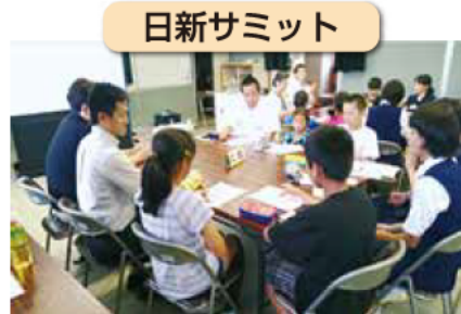
▲話し合いのようす