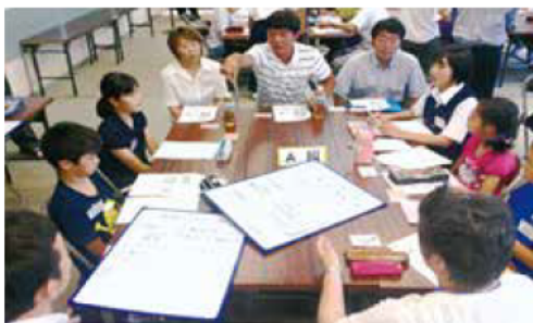
▲ホワイトボードに意見をまとめた