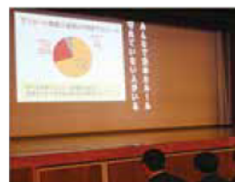
▲全校集会のプレゼンテーション