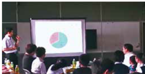
▲アンケート結果の共有