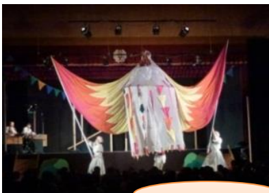
巡回公演「演劇公演」 ≪宇都宮市立岡本小学校≫

そこで、栃木県教育委員会では、文化庁や各団体と連携して、子供たちにオーケストラやミュージカル、演劇や落語等、「本物体験」ができる文化事業を提供しています。次年度以降も市町教育委員会を通して募集しますので、ぜひご検討ください。