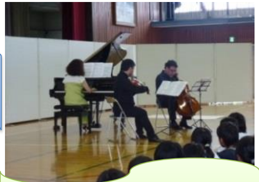
移動音楽鑑賞教室 「ヴァイオリン、チェロ、ピアノのコンサート」 ≪上三川町立上三川小学校・北小学校・坂上小学校≫ 3校合同