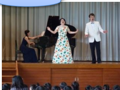
学校訪問演奏会「声楽」 ≪宇都宮市立篠井小学校≫