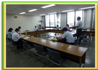
学校と地域の連携推進会議

学校を核とした地域づくり支援 ・学校と地域を結ぶコーディネート機能の強化 ・地域人材のネットワーク構築