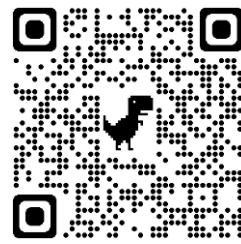
上都賀地区 「人権ふれあいフェスタ」 申込みQRコード