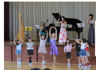
← 壬生町立 睦小学校