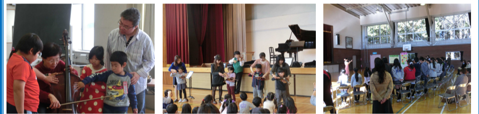
壬生町立藤井小学校