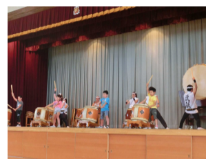
← 栃木市立 静和小学校

平成27年度の「巡回公演事業」は、 下都賀地区が優先地域 、「芸術家の派遣事業」は、 県内全域が対象 となっております。本物を体験できる素晴らしい内容ですので、ぜひ、多くの子供たちに体験してほしいと願っております。