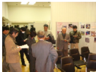
那須塩原市永田自治会