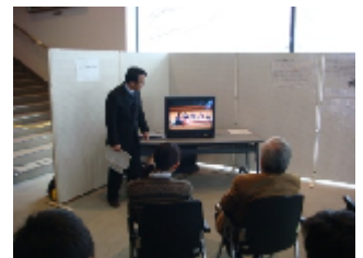
ふれあい学習推進会議

事例発表団体の一つである栃木県立那須高等学校は、地元の素材を使った商品開発(黒田原バーガー等)や「R「駅からハイキング」への企画参加など学校、企業、地域が一体となつての地域活性化という内容で「那須高校・観光プラン」を発表しました。その他の団体も雅楽の演奏やかたりべの実演などを盛り込み、活動内容や活動を始めたきっかけについて各団体とも工夫を凝らした発表をしました。