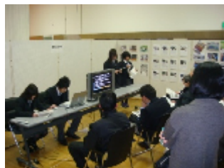
栃木県立那須高等学校