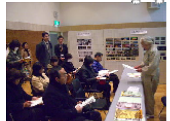
那須のかたりべの会