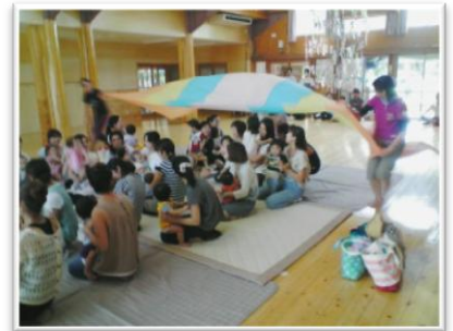
社会教育主事有資格者 ステップアップ研修 10月14日(金)安蘇庁舎にて

その後、安蘇庁舎にて、佐野市・足利市・安足教育事務所における社会教育主事の日常業務等についての発表があり、管内の社会教育の実践についての理解を深めました。