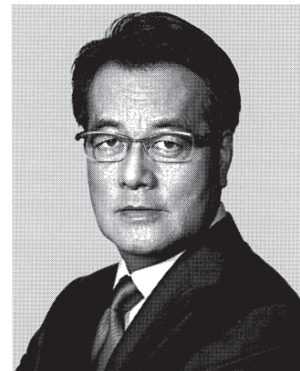
民進党代表 岡田 克也