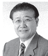
参院議員 市田 忠義 現 1942年、大阪府生まれ。立命館大学卒。参院3期。党国會議員団総会長・参院議員団長。 【活動地域】京都