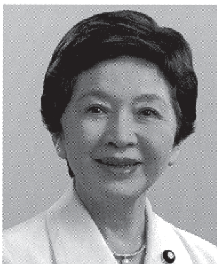
日本のこころ代表 中山 恭子 元拉致問題担当大臣