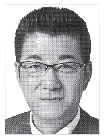
代表 松井 一郎