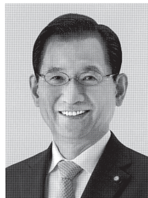
は ま だ