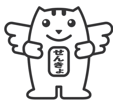
明るい選挙キャラクター 選挙のめいすいくん