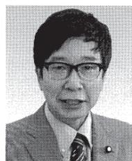
参院議員 大門みきし 現 1956年、京都市生まれ。神戸大学中退。参院3期。党参院国対副委員長。 【活動地域】京都以外の近畿