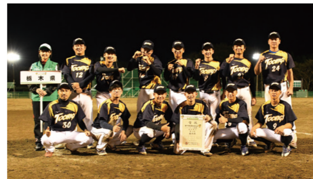
成年男子チーム 3位