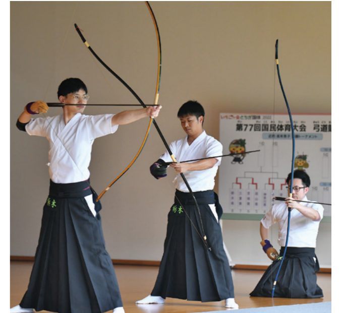
成年男子 近的 6位