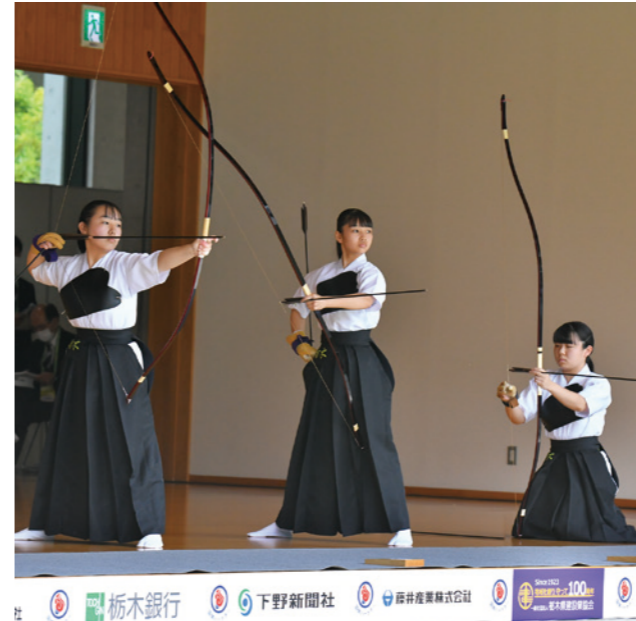
少年女子 遠的 3位