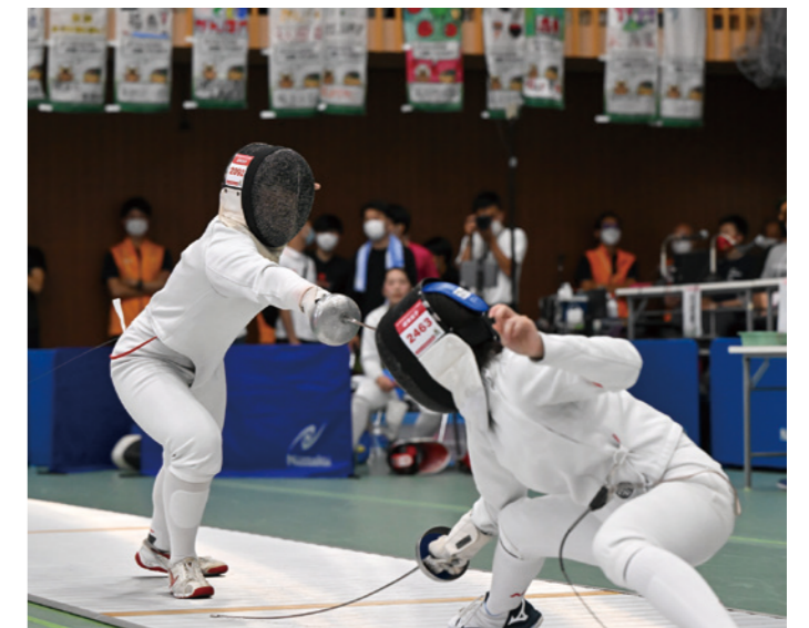
成年女子 エペ 2位