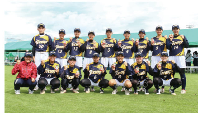
少年女子チーム 3位