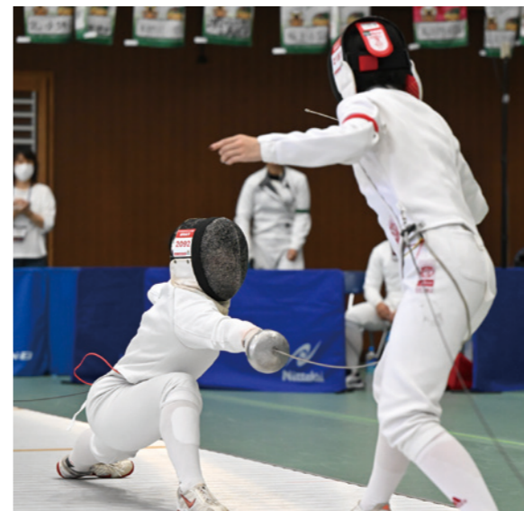
成年女子 エペ 2位