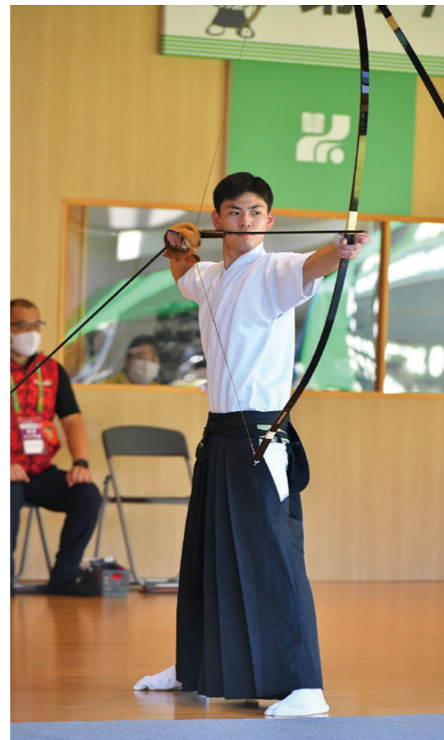
少年男子 遠的 4位