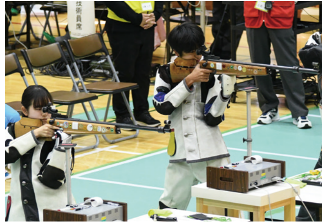
ビームライフル 少年ミックス 4位