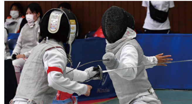
少年女子 フルレー