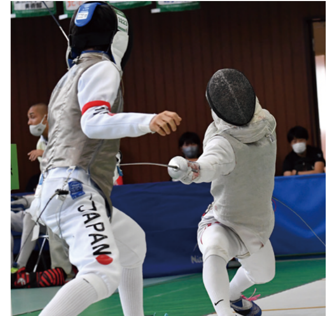
少年男子 フルレー