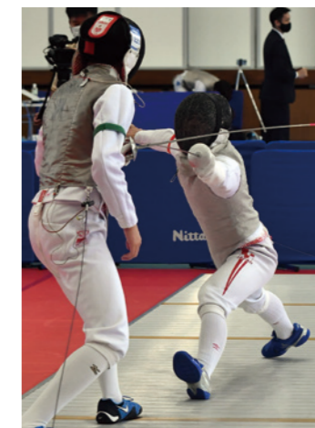
成年男子 フルレー 5位