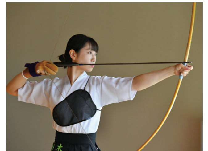
成年女子 遠的 1位/近的 5位