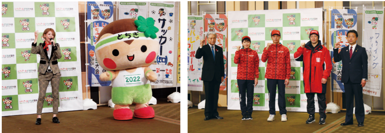
【開催1年前(冬季大会100日前)記念企画 いちご一会オンラインイベント】