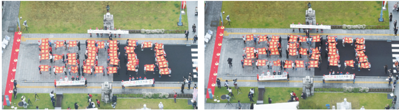
【開催1年前(冬季大会100日前)記念企画 いちご一会オンラインイベント】