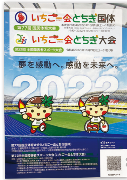
両大会パンフレット