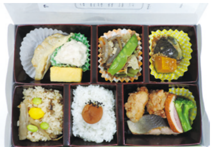
【栃木で元気になる弁当】

おしながき/御飯 栃木県産とちぎの星、ゆばの和え物、シューマイ、厚焼玉子、チキンステーキと揚げ餃子のとちおとめのステーキソース添え、モロのフライ、かんぴょうの甘辛煮、こんにゃくの煮物