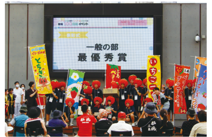
【広報ボランティア】