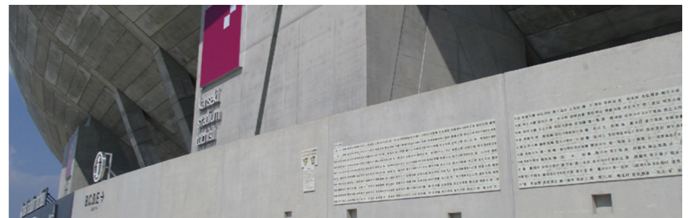
募金(寄附金)協力者の銘板