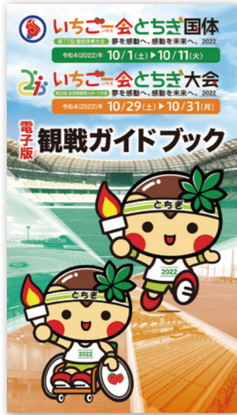
観戦ガイドブック(電子版)