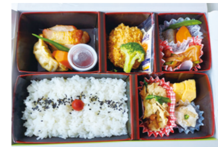
【とちぎのいちご一会おもてなし弁当】

おしながき/御飯 栃木県産とちぎの星、ゆばの和え物、シューマイ、厚焼玉子、チキンステーキと揚げ餃子のとちおとめのステーキソース添え、モロのフライ、かんぴょうの甘辛煮、こんにゃくの煮物