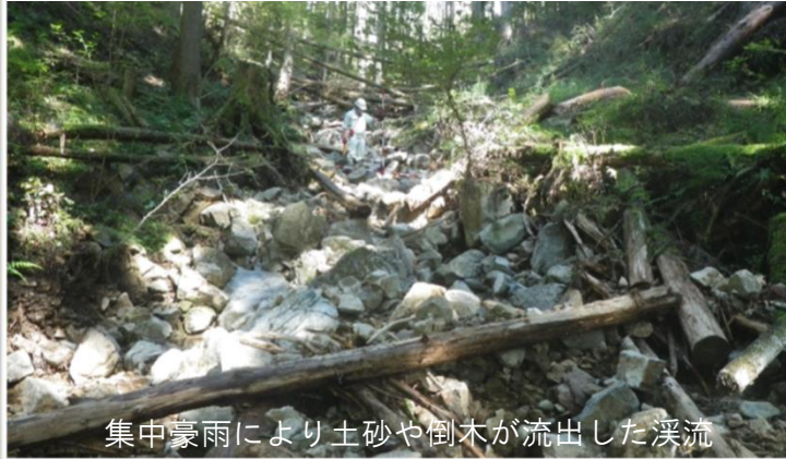
集中豪雨により土砂や倒木が流出した溪流

県民の生命や財産を守り、国土の強靱化を図るため、治山事業を推進しています。台風やゲリラ豪雨、地震などにより、山腹崩壊や荒廃渓流が発生した保安林の復旧を行います。