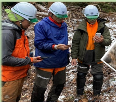
アプリを使った現場管理

林業で働く人づくりと積極的なAIによる未来技術の活用を併せ、稼げる林業の実現を進めています。