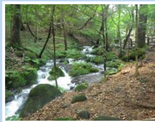
尚仁沢自然環境保全地域 (塩谷町尚仁沢湧水群)

豊かな自然環境を保全するため、優れた天然林や野生動物の生息地などの区域を「自然環境保全地域」として、また、歴史的、文化的遺産と一体となって良好な緑地環境を形成している地域を「緑地環境保全地域」として管理しています。