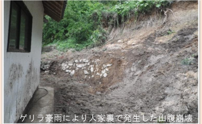
ゲリラ豪雨により人家裏で発生した山腹崩壊