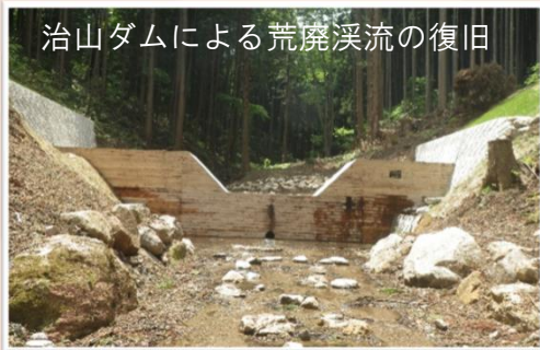
治山ダムによる荒廃溪流の復旧