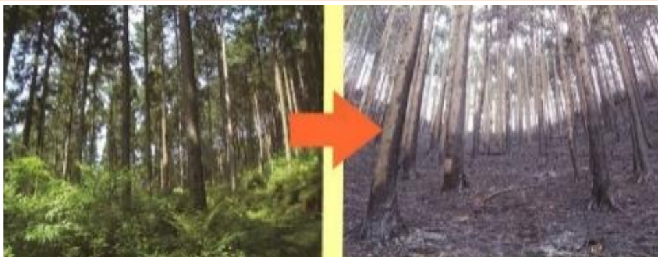
山火事により被災した森林