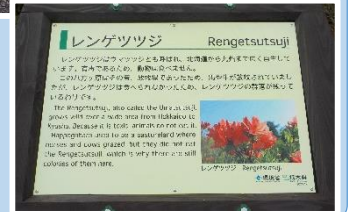
解説板の多言語化