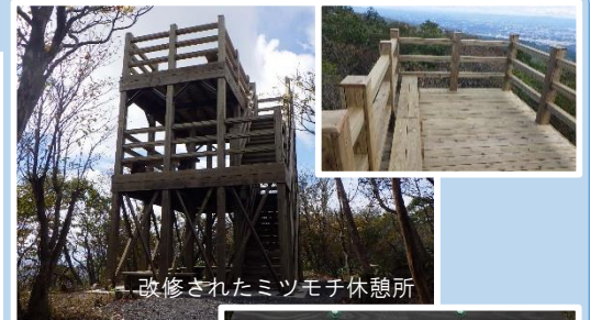
改修されたミツモチ休憩所

特に、より多くの方が快適で安全に利用できるよう、歩道や休憩所の改修を中心に、多様化する利用者のニーズに応えるため、標識や解説板の多言語化なども行っています。