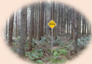
保安林指定における制限と優遇措置

身近にある森林を健全に保つことで、災害を未然に防ぎ、私たちの安心安全な生活を支えています。