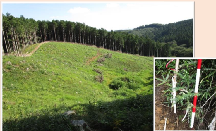
エリートツリーの試験植栽

また、県内の林業や自然環境の試験・研究（エリートツリー）、モデル的施業（複層林等）、各種講習会、オリエンテーリングなど様々な目的を持ったフィールドとして、多くの人々に活用されています。