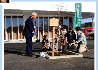
みどりのおもてなし 植樹会 (塩谷町)