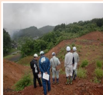
定期的なパトロールの実施

許可に際しては、開発による水害の発生や周辺地域への影響等を審査することとしており、許可を受けた箇所については、施工状況を確認するため、定期的にパトロールを実施しています。