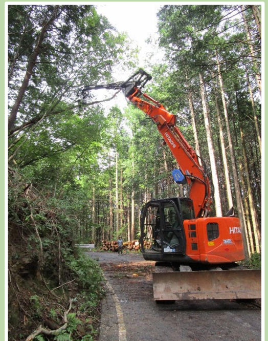
ロングリーチ グラップルソー