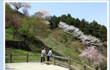
喜連川緑地環境保全地域 (さくら市お丸山公園)