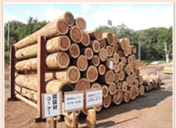
森林認証による信頼の経営