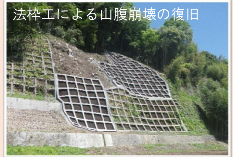
法枠工による山腹崩壊の復旧