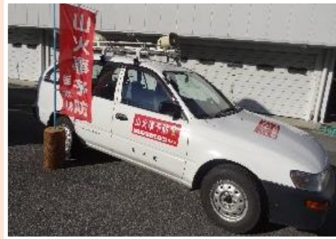
注意喚起広報活動

山火事の原因は、「たき火」や「野焼き」の際の火気の取扱い不注意や不始末等の人為的なものが多くを占めています。廃棄物処理法により、野焼きは原則禁止されているほか、認められる場合においても、市町長の許可が必要ですので注意してください。