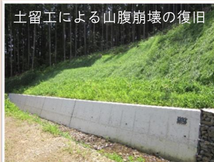
土留工による山腹崩壊の復旧