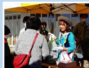
苗木配布会 (塩谷町)

庭木の手入れでお困りの際には、グリーンアドバイザーが相談に応じますので、御連絡ください。