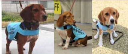
ハンター (♂) リトルマン (♂) ユズ (♀)