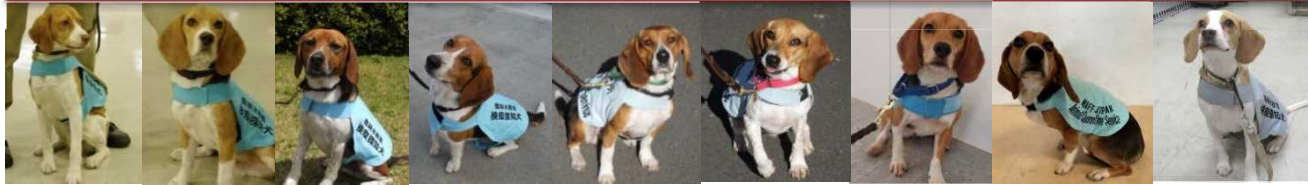
ティナ (♀) ギャリー (♂) タリー (♂) ジャグ (♂) メグ (♀) ポタン (♀) ピーチ (♀) ジン (♂) ビス (♀)