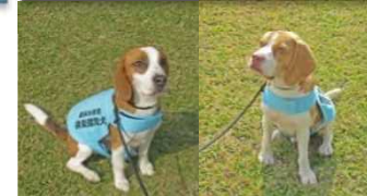
シーザー (♂) ラスティール (♂)