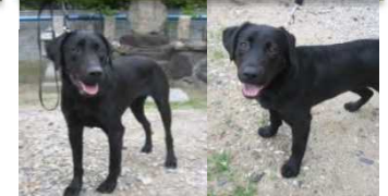
ハーパー (♀) ビーン (♀) (9)