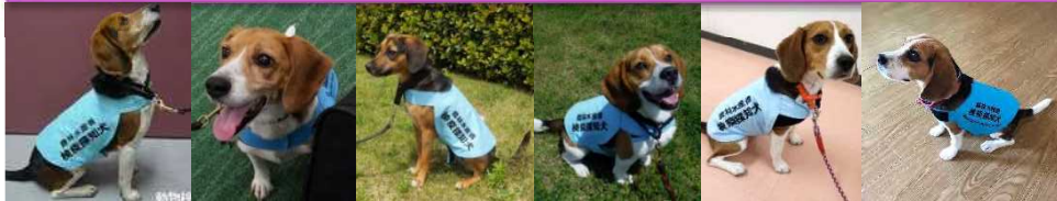
バックー (♂) ニール (♂) ダブ (♀) フジ (♂) ルイ (♀) マリー (♀)