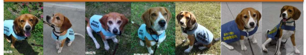
セシル (♂) ボウ (♂) アルバート (♂) バイユー (♂) タロウ (♂) ラン (♀) サプロウ (♂)