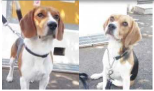
ナイトロ (♂) ロキシール (♀)