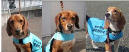
タンク (♂) アリーシャ (♀) ジロウ (♂)