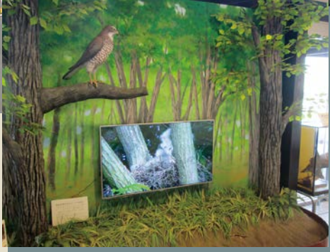
市貝町サシバキャラクター サシバのサッちゃん